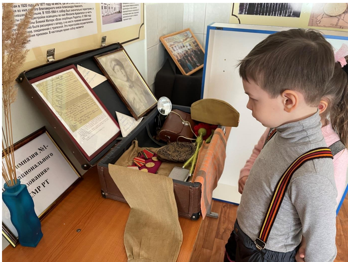
Экспозиция «Тысячелетняя Елабуга»